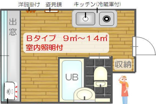
学生向け1Rマンション 女性管理人常駐・仲介手数料無料