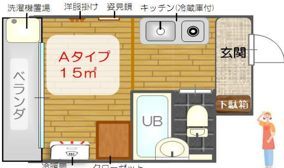
学生向け1Rマンション・女性管理人常駐・仲介手数料無料

サンセイHDでは、ご進学予定の方向けに以下の学生向けマンション(卒業後も入居可能)をご用意しております。 選べるお部屋は3タイプ(物件により条件等が異なりますのでお問合せください。)