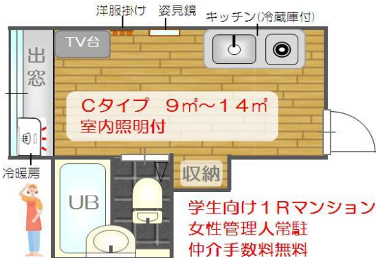
学生向け1Rマンション 女性管理人常駐 仲介手数料無料