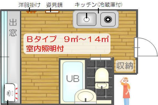
学生向け1Rマンション 女性管理人常駐・仲介手数料無料